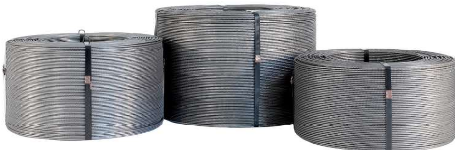
Tabelle draht in ringen